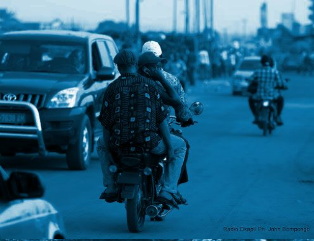
Radio Okapi Ph. John Bompengo