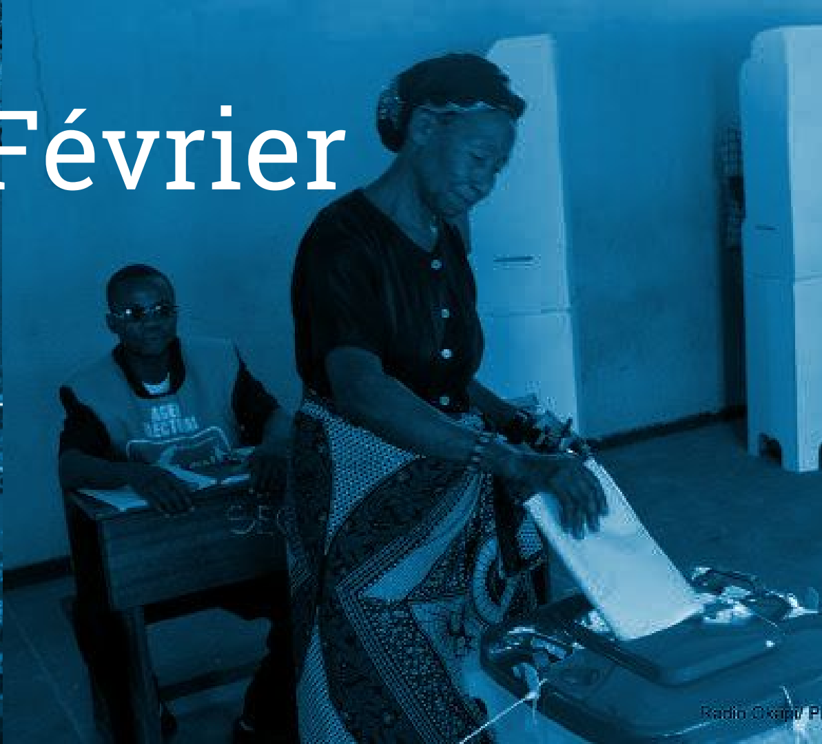
Radio Okapi P