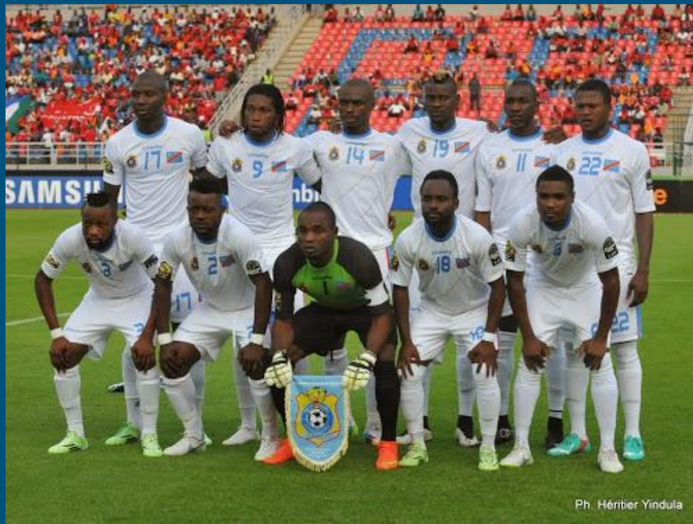
Ph. Héritier Yindula

http://www.radiookapi.net/sport/2015/02/04/2015-la-cote-divoire-elimine-la-rdc-3-1